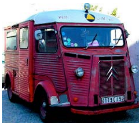
Photo Le Citroën Type HY par Pedro Ribeiro Simões/photos/pedrosimoes7/ (CC BY 2.0)

Croix-Rouge vaudoise, Rue Beau-Séjour 9-13, 1002 Lausanne